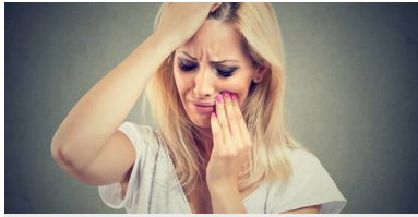
Ból zęba - różne typy, odmienne przyczyny