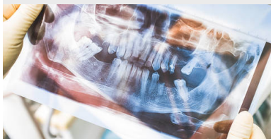
Samolot i chory ząb - koszmarna kombinacja