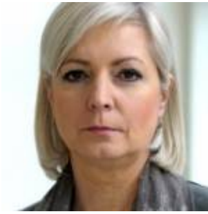
Iwona Schymalla , 2021-11-17 10:00