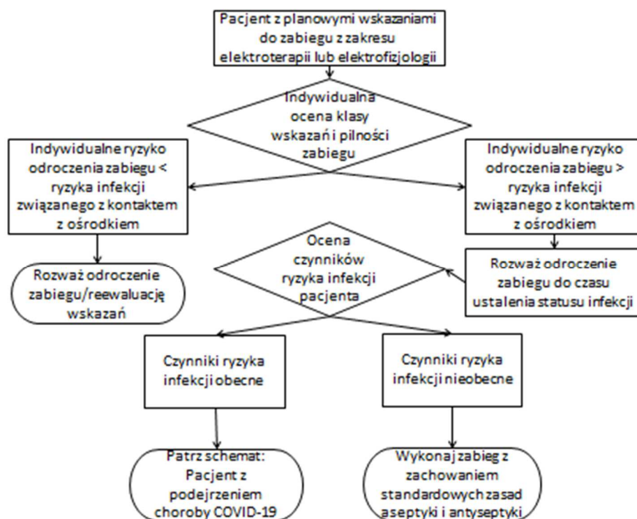
Ryc. 1. Schemat postępowania w przypadku pacjenta z planowymi wskazaniami do przeprowadzenia zabiegu z zakresu elektroterapii lub elektrofizjologii.

B. Osoby z podejrzeniem infekcji COVID 19 (osoby z kwarantanny, oczekujące na wynik testu oraz z dodatnim wywiadem wskazującym na możliwość zakażenia) – we wszystkich przypadkach wykonywanie procedur w miarę możliwości powinno być odroczone do czasu potwierdzenia lub wykluczenia zakażenia. Po wykluczeniu zakażenia osoby te powinny być traktowane jak pacjenci z populacji ogólnej – punkt A. W przypadku potwierdzenia zakażenia – patrz niżej – punkt C. W sytuacjach bezpośredniego zagrożenia życia (np. blok przedsionkowo-komorowy III stopnia bez wydolnego rytmu zastępczego, burza elektryczna bez możliwości farmakologicznego opanowania arytmii) osoby o niejasnym statusie epidemiologicznym powinny być poddane procedurom niezwłocznie, optymalnie w ośrodkach jednoimiennych dysponujących możliwością izolacji takiego pacjenta oraz